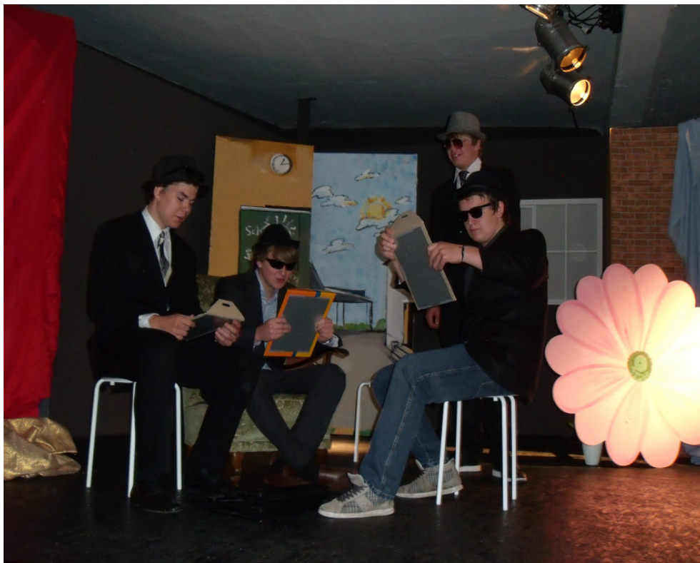
Die Jungs fanden für alle Lehrkräfte passende, liebevolle Worte!