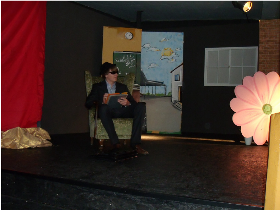
Psychiater Dr. „Der Mann mit dem Doppelname“